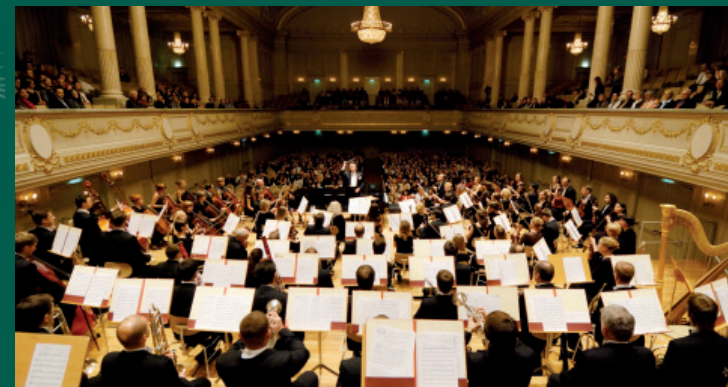
Kultur-Casino, Bern 2008