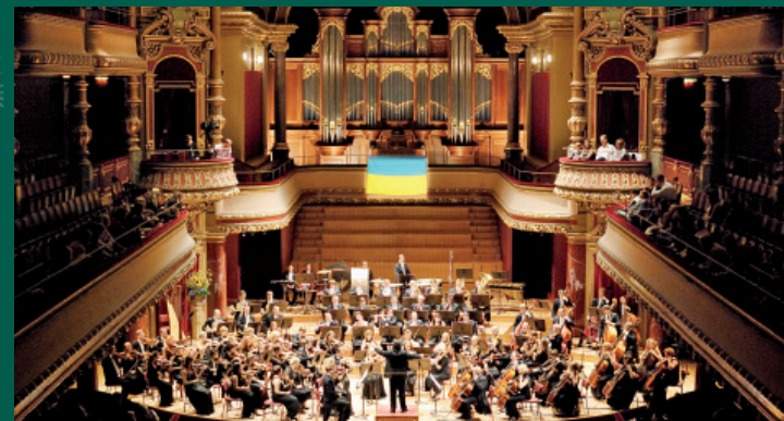
Victoria Hall, Genève 2009