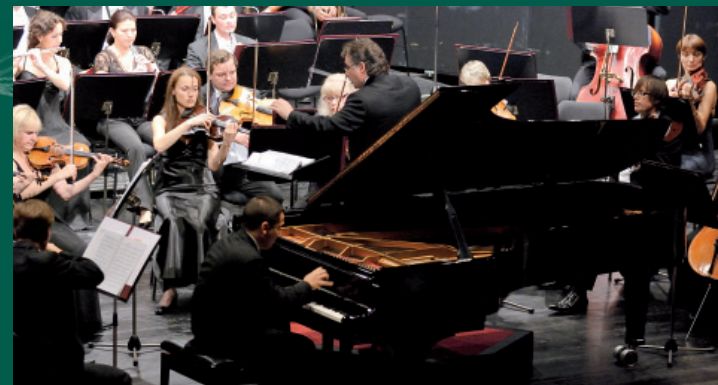
Vaduzer-Saal, Vaduz 2009