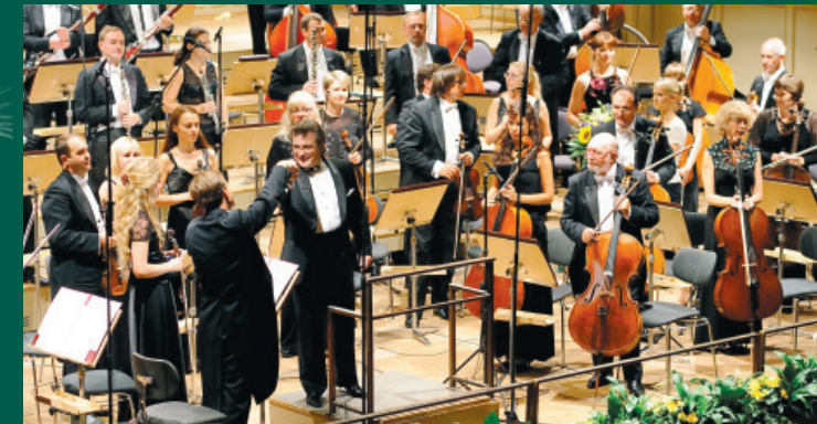
Tonhalle, Zürich 2009

MAURICE DE MAURIAC MANUFACTURED IN ZÜRICH